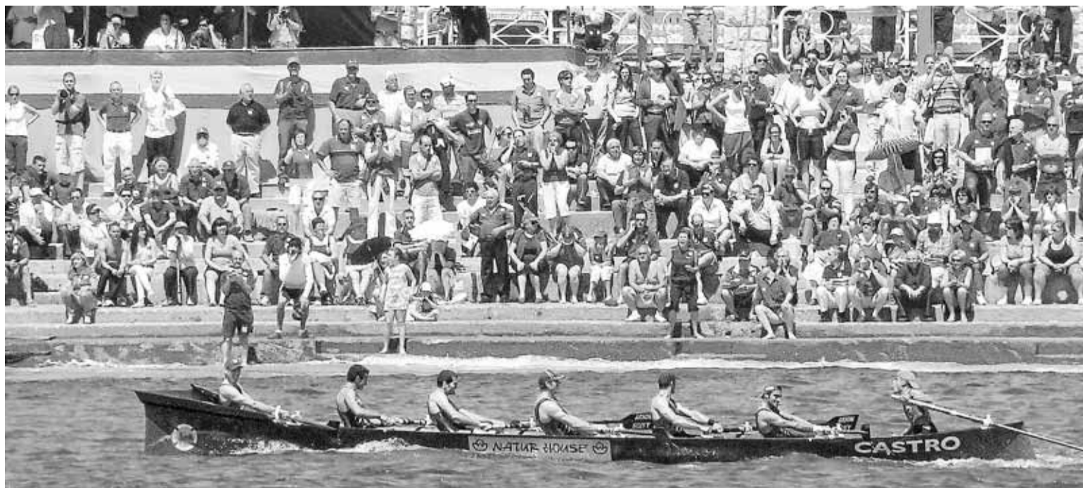
La embarcación castreña afronta el campeonato con la intención de mantener los títulos logrados en 2009. :: E.V.