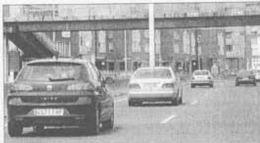
El precio de los vehículos de segunda mano sigue cayendo.